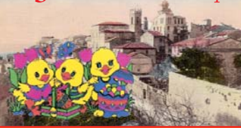
L'Amministrazione Comunale rivolge a tutti sinceri auguri